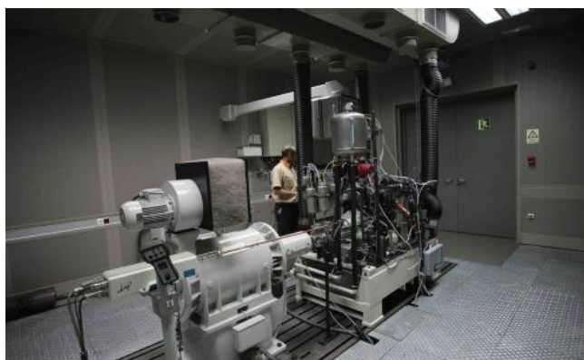
Imagen de celda de ensayos motor