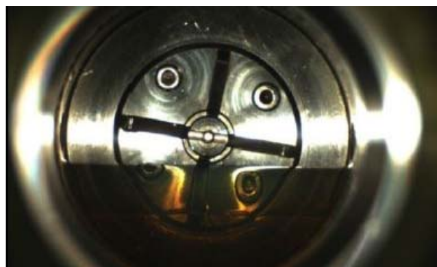
Ensayo de visualización de interfase líquido-vapor. Interpretación de volumetría mediante software integrado